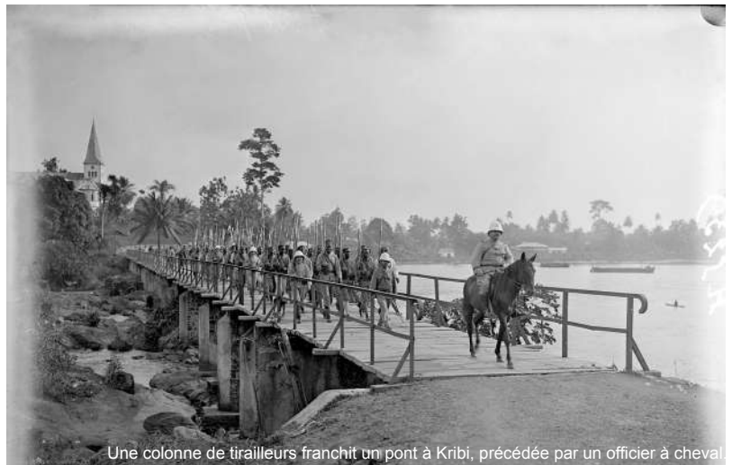
Une colonne de tirailleurs franchit un pont à Kribi, précédée par un officier à cheval

Cette exposition itinérante et mobile a été réalisée par l'association Solidarité Internationale , en hommage à ces soldats africains sacrifiés durant ce conflit et trop souvent oubliés. Cette exposition mémorial est par ailleurs labellisée « Mission du Centenaire » de la Grande Guerre.