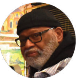
M. Emmanuel BOTTIUS Association photographique Positif 94

L'association a pour but de promouvoir le livre et la lecture, soutenir les petites maisons d'édition et les librairies non soumises aux grands circuits commerciaux, VLE organise la récupération et la distribution de livres dans les chalets à livres créés par l'association.