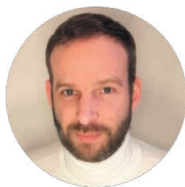
M. Nicolas CADIOU Maq'image

L'association s'inscrit dans le monde de la création et dans le langage photographique argentique et numérique. Elle est également partie prenante dans la vie de la collectivité culturelle.