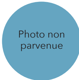
Photo non parvenue